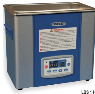
LBS 1 H

3 L kapacitet. Idealiskt för rengöring och eliminering av alla typer av föroreningar med kavitation, tack vare vibrationseffekten som erhålles av ultraljudkraften. Digital temperaturkontroll och timerfunktion som programmerbar, eller kontinuerlig drift. Tankmått (LxBxD): 360x300x150 mm. Frekvens 35 Hz, Ultraljudeffekt: 100W, värmeeffekt: 88 W, temperatur: 20-69°C. Utan möjlighet till förändring av frekvensen (andra modeller finns, kontakta oss). Ingen dräningsmöjlighet. Stödgaller ingår. Tillbehör som stållock och stålkorg, samt rengöringslösning finns.