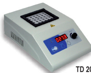
TD 200 P1

Perfekt för all laborativ verksamhet vid behov av uppvärmning, kylning, smältning, inkubering, koncentrerings. Med nytt integrerat tre-steg-program väl användbart i enzymatiska-, kemiskt katalytiska reaktioner. Med timerfunktion. Temperatur 25 till 200 °C, värmeeffekt 150 W, externa mått: 285x200x110 mm, 2,0 kg, IP40. Modeller med 2 resp. 3 block, samt blocktermostat med såväl kylning och värmning finns också i sortimentet. Ett stort urval av block finns tillgängliga och tillkommer i priset, vänligen se broschyrer eller kontakta oss.