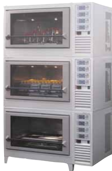
Rabatten gäller på alla Kühners skakinkubatorer

AB Ninolab har lång erfarenhet av försäljning och service av skakinkubatorer vilket gör Kühners produkter till en långvarig och säker investering.