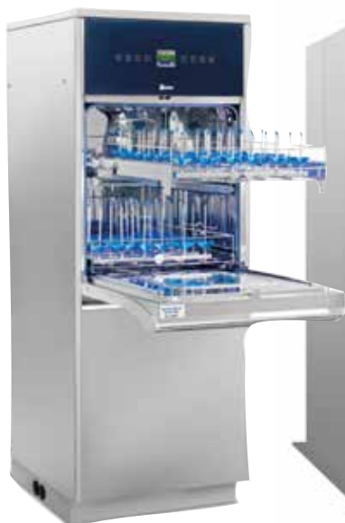
LAB 610 En av våra mellanstora modeller med plats för disk i upp till 5 nivåer, alt. högt gods på 1-2 nivåer.