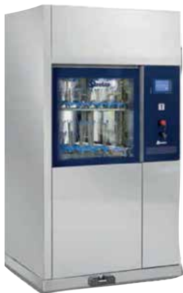
LAB 1000 En av våra större labdiskmaskiner, perfekt för er som önskar större diskkapacitet.

diskmaskiner till Pharmadiskmaskiner som utformas enligt kundens behov. Modeller finns både med enkeldörr och som genomgångsmodeller.