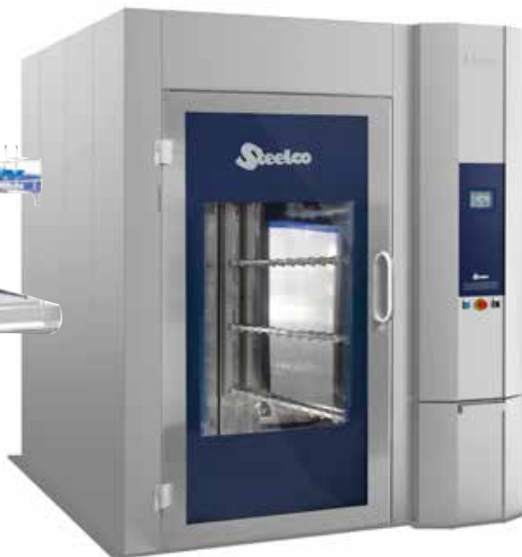
AC7500 Bur och vagnsdisk för er med större diskbehov